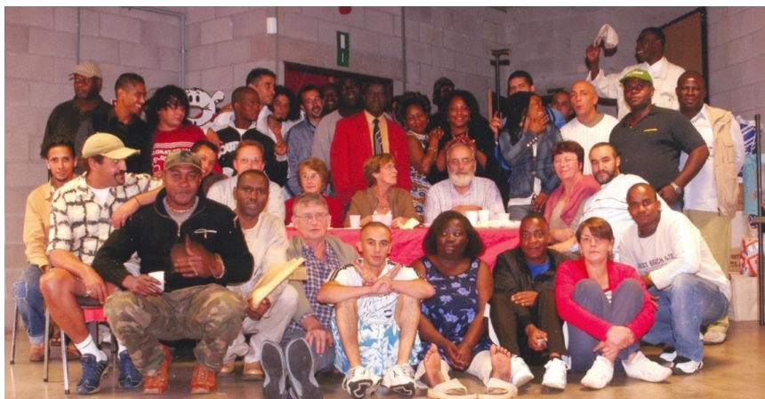
Photo des sans-papiers hébergés dans l'église SFS en 2006